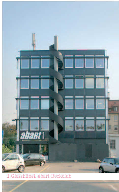
1 Giesshübel: abart Rockclub

Täglich sehen Sie die gleichen Gebäude, Häuser, Schriftzüge, Werbetafeln, Wände. Die Bilder ziehen vorbei. Und wäre es manchmal nicht schön, Bildlegenden zu haben? Oder Beschriftungen wie für ein Bergpanorama? Entdeckungen auf der S4.