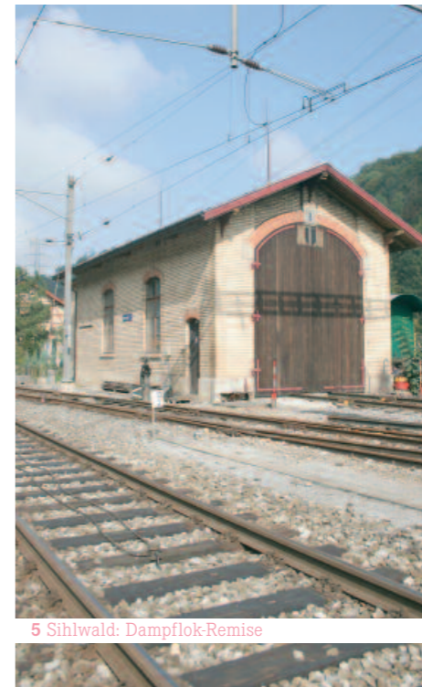
5 Sihlwald: Dampflok-Remise