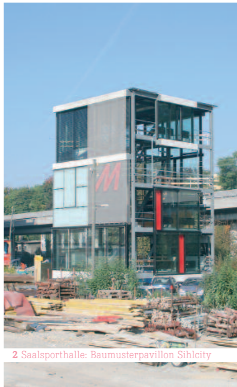
2 Saalsporthalle: Baumusterpavillon Sihlcity