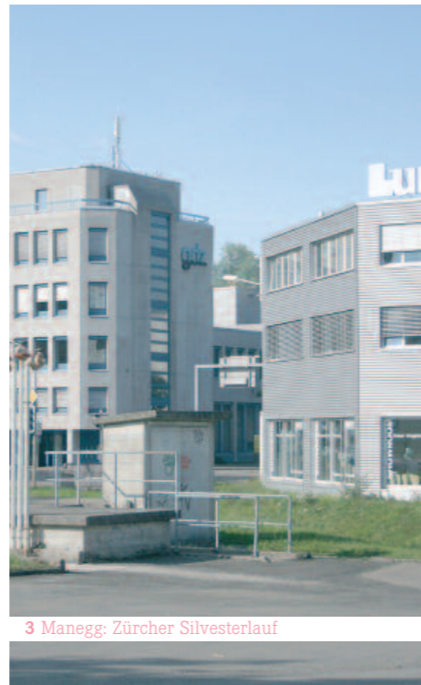
3 Manegg: Zürcher Silvesterlauf