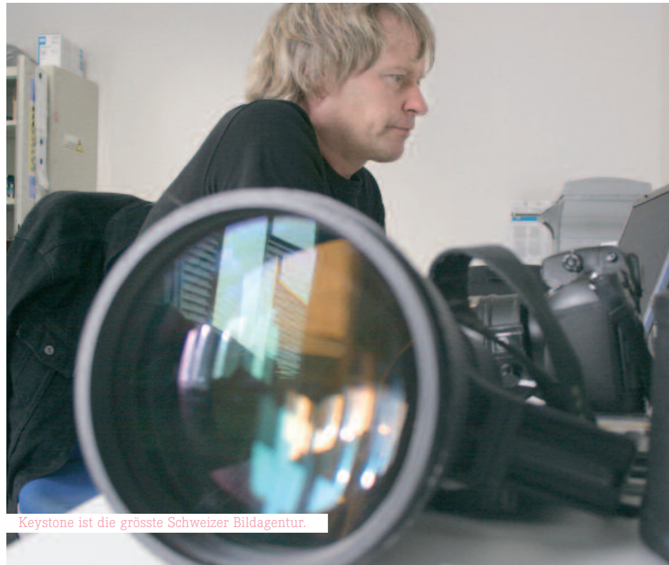
Keystone ist die grösste Schweizer Bildagentur.