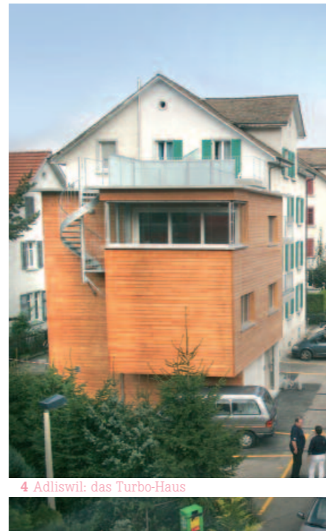
4 Adliswil: das Turbo-Haus